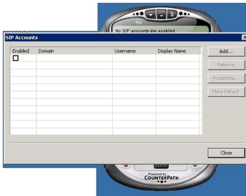
Imagen 23: SIP Account Settings XLite 3.0

3. Le aparecerá una ventana en blanco donde podrá colocar sus cuentas SIP Presioné el botón ADD (Agregar) que aparece a mano derecha. ( ver Imagen 2-3 )