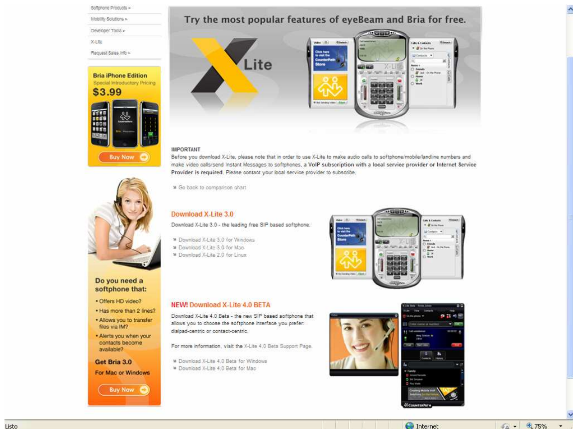
Imagen 1-1: Sitio web xlite

http://www.counterpath.com/x-lite-download.html