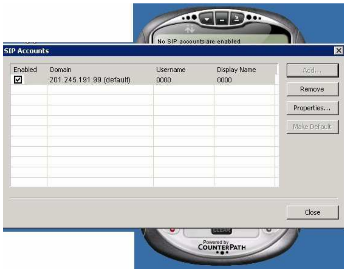
Imagen 2-6: Cuenta SIP creada XLite 3.0

8. El cliente verá nuevamente el softphone XLite y tendrá que esperar unos segundos mientras el programa trata de conectarse a la cuenta SIP que solicitó en EMSITEL. Luego en la pantalla del softphone XLite deberá aparecer YOUR USER NAME: xxxxxxxxx (SU NUMERO DE CUENTA).