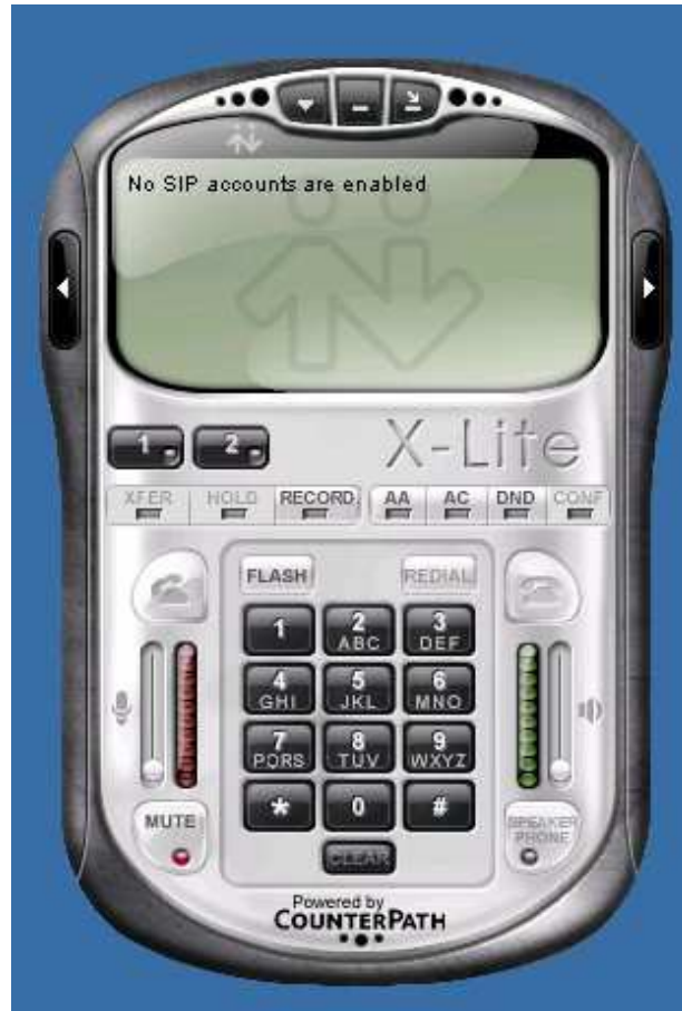
Imagen 2-1: XLite 3.0