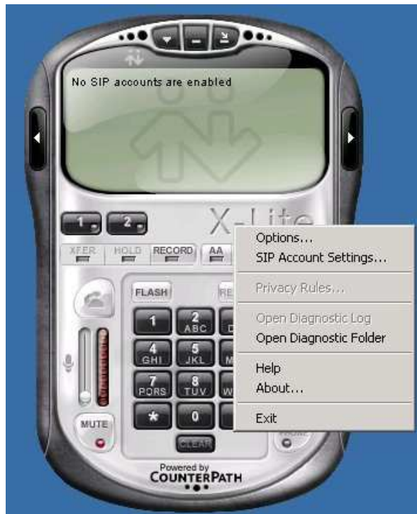
Imagen 2-2: Menú XLite 3.0

3. Le aparecerá una ventana en blanco donde podrá colocar sus cuentas SIP Presioné el botón ADD (Agregar) que aparece a mano derecha. ( ver Imagen 2-3 )